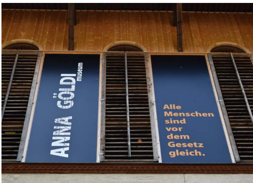
↑ Aufschrift am Anna-Göldi-Museum.

1865 ist der Hänggiturm für die Stoffdruckerei Conrad Jenny, Ennenda, vom Architekten Hilarius Knobel erbaut worden. Das monumentale Fabrikations- und Lufthängegebäude gehörte nach 1900 zur Schweizerischen Teppichfabrik und ab 1978 zum Forbo Konzern. Zwischen 1828 und 1856 diente es der Zeugdruckerei Bartholome Jenny. Nach dem Abriss 1987 wurde die alte Holzkonstruktion 1992 und 1993 auf einem modernen Unterbau wieder aufgebaut. Der Wiederaufbau wurde durch Beiträge des Bundes, des Kantons, des Heimatschutzes, der Forbo AG und weiteren Spendern ermöglicht. Das Gebäude steht unter Schutz von Bund und Kanton.