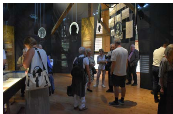
↑ Die Mitglieder der Pro Raetia vertiefen sich in die Geschichte der Anna Göldi.