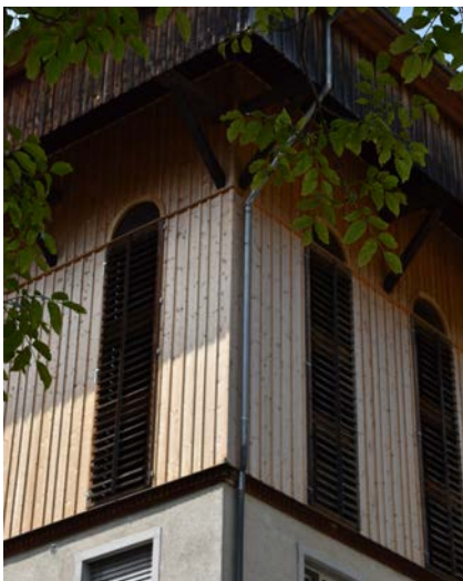
↑ Im markanten Holzaufbau des Hänggiturms in Ennenda ist das Anna-Göldi-Museum untergebracht.