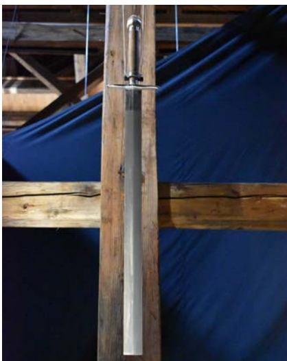
↑ Anna Göldi wurde mit dem Schwert hingerrichtet.

Im 18. Und 19. Jahrhundert florierte im Kanton Glarus die Textilindustrie. Noch heute bekannt und gerne getragen ist das «Glarner Tüechli».