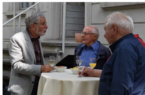
↑ Angeregte Diskussion beim Apéro im Garten des Hotels Glarnerhof.