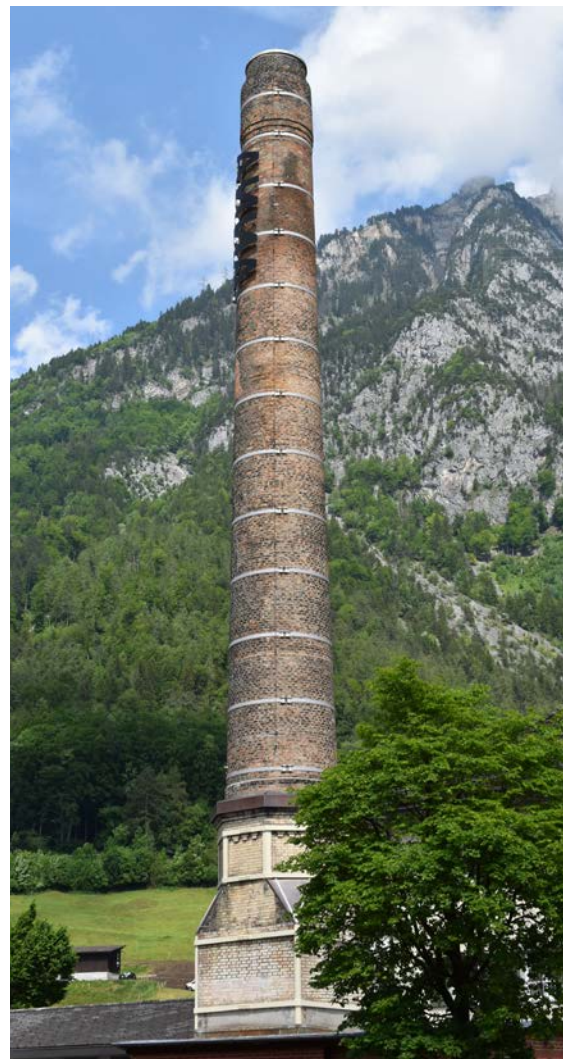
↑ Hochkamin in Ennenda aus dem 19. Jahrhundert. Nachdem er einzustürzen drohte, wurde er 2018 restauriert. 2020 wurde die Beschriftung «Anna» angebracht.

Trotzdem: Die erhaltenen Fabrikgebäude und die industriezugehörigen Bauten umfassen einen Zeitraum von über 200 Jahren und überraschen durch ihre Vielfalt. Drei kleine Fabriken in Blockbauweise repräsentieren Vorformen des Fabrikbaus. Zwischen 1780 und 1840 entstanden einige grosse Fabriken, deren Fassaden bewusst an den Schlossbau erinnern. Später zeigten die Fabrikgebäude äusserste Nüchternheit mit eintönigen Fensterreihen unter einem Satteldach. Nach 1880 griff die Fabrikarchitektur erneut auf einzelne Formen des Burgen- und Schlossbaus zurück. Moderne Fabriken zeichnen sich da und dort durch eine qualitativ hochstehende Architektur aus. Einzelne Ensembles vereinigen interessante Gebäude aus verschiedenen Epochen.