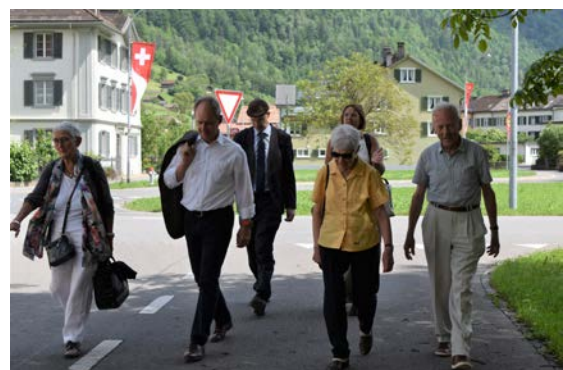
↑ Spaziergang zum Anna-Göldi-Museum.